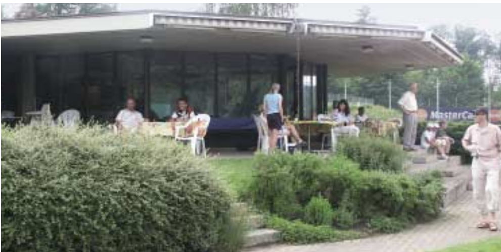
Das moderne Clubrestaurant bietet einen Blick auf alle sechs Plätze an der Nidelbachstrasse.